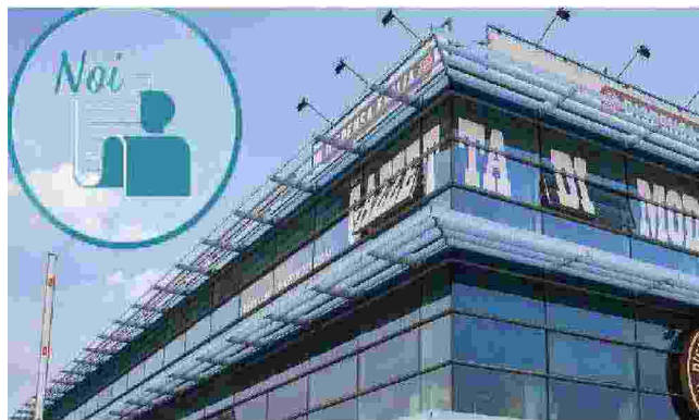
L'immagine simbolo di "Noi Gazzetta di Modena"

Modena Nerd è uno degli eventi per i quali i nostri lettori, iscritti alla comunità "Noi Gazzetta di Modena", avranno un trattamento di riguardo. Per loro sono infatti previsti delle riduzioni -sconto sul costo del biglietto di ingresso, alcuni pass speciali per partecipare all'incontro con i Gem Boy e con Cristina D'Avena.